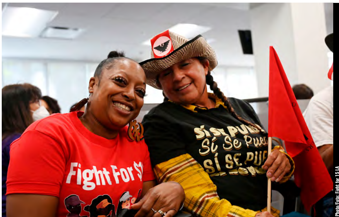
Fight for 15 LA joined the Farm Workers Union as powerful advocates to urge California Gov. to sign AB2183, allowing farmworkers to participate in union elections. / Fight for 15 LA se unió al Sindicato de Trabajadores Agrícolas como poderosos defensores para instar al gobernador de California a que firme la ley AB2183, que permite a los trabajadores agrícolas participar en las elecciones sindicales.