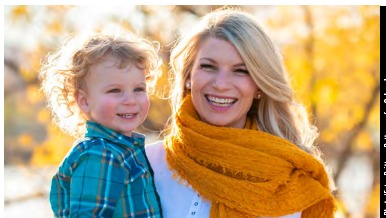
U.S. Congressional candidate, Colorado State Senator Brittany Pettersen. / La candidata al Congreso de los Estados Unidos, la senadora estatal de Colorado Brittany Pettersen.

United States Congress the same balanced political perspective she has demonstrated in the Colorado Legislature along with her ability to envision current and future needs of her constituents. She served in the Colorado House from 2013-2019 and currently in the Colorado Senate since January of 2019.