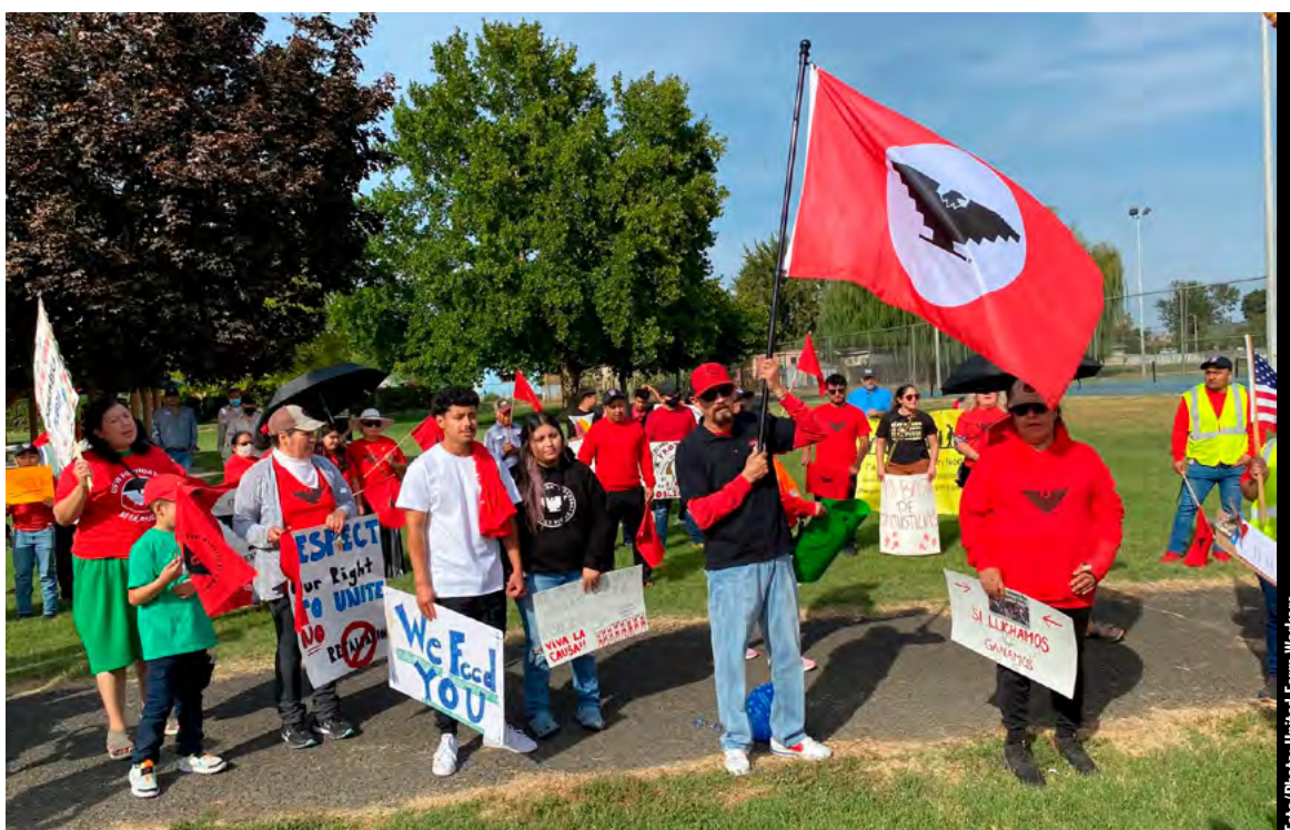
La Unión de Campesinos y sus defensores impulsaron una legislación para facilitar la participación de los trabajadores agrícolas de California en las elecciones sindicales. / The United Farm Workers and advocates pushed for legislation to make it easier for farmworkers in the California to participate in union elections.