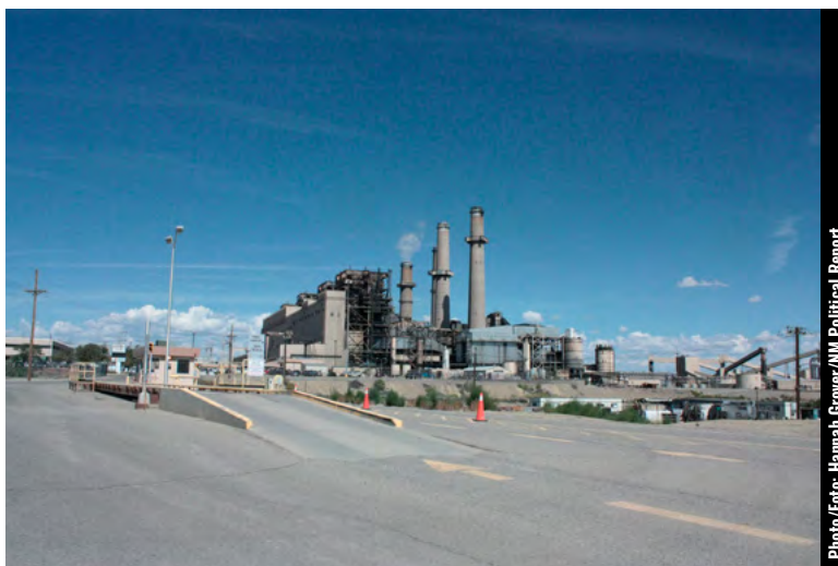
The final day of operations at San Juan Generating Station. / El último día de operaciones en la Estación Generadora de San Juan.

"Part of that is just how quickly renewables got cheap and accessible," she said.