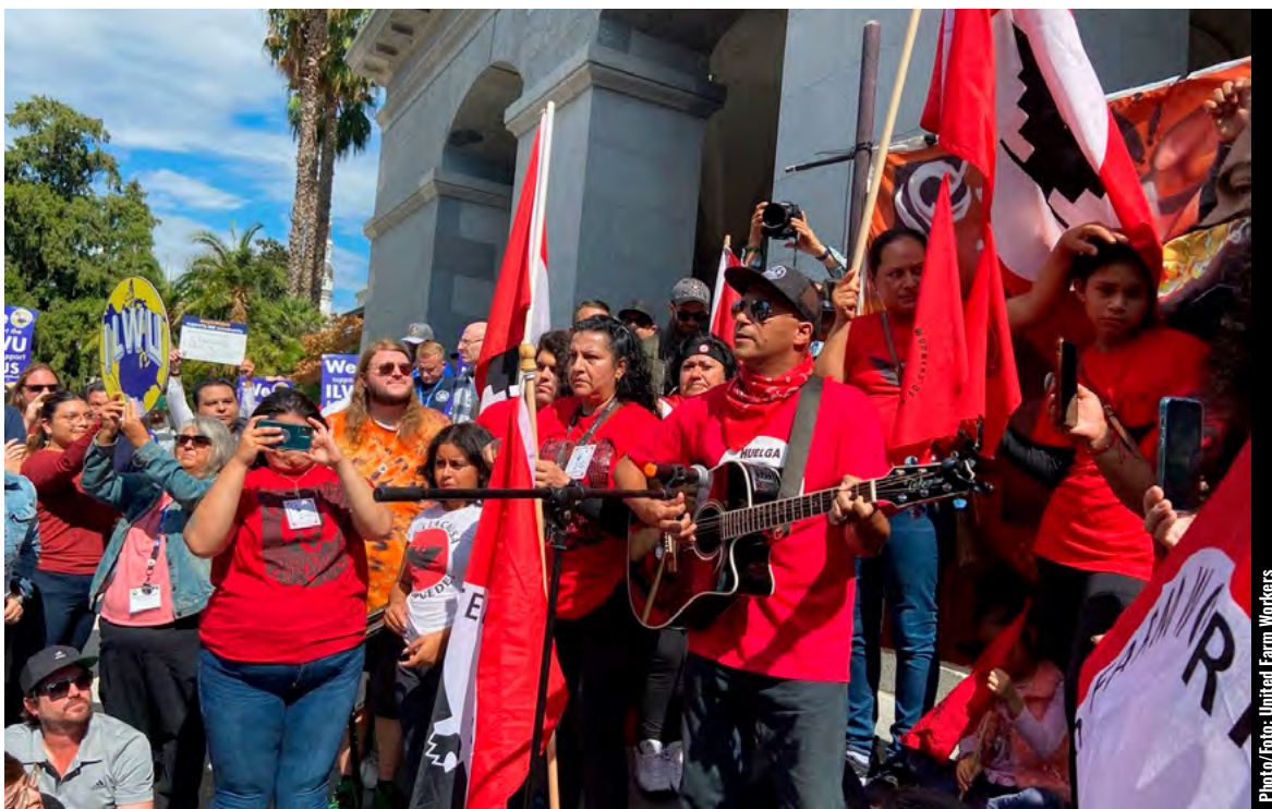
Tom Morello, activist leader of Rage Against the Machine, is an avid supporter of United Farm Workers and supporter their effort to pass AB2183 in California. / Tom Morello, líder activista de Rage Against the Machine, es un ávido partidario de United Farm Workers y de su esfuerzo por aprobar la ley AB2183 en California.

Starting on August 3, as KCRA reported last week, UFW members embarked on "a 24-day, 335-mile journey from Kern County, near Bakersfield, to the state capitol, a march that civil rights activist César Chávez first led in 1966."