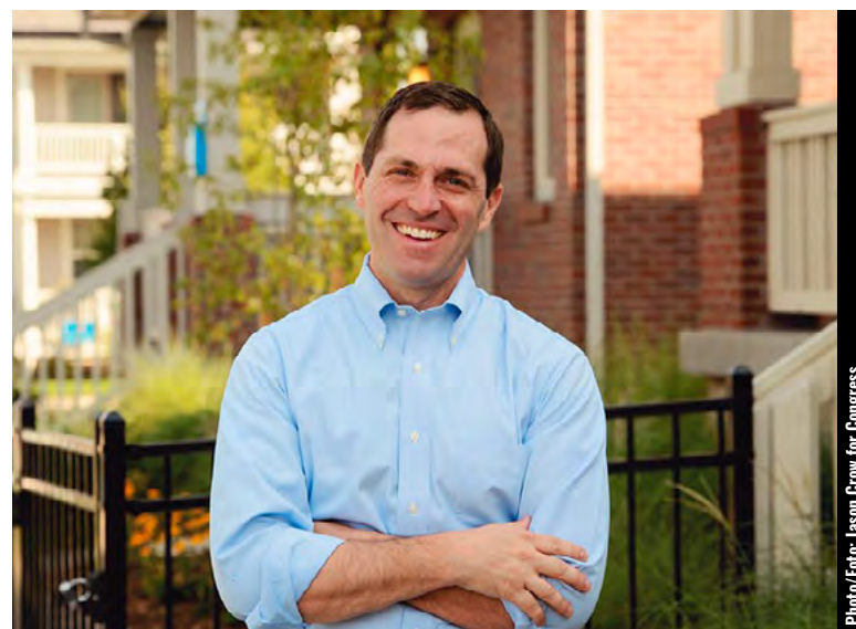
U.S. Congressman Jason Crow. / El congresista estadounidense Jason Crow.

Congressman Crow has stood at the forefront in demanding legislation on humane and just immigration reform, as well as calling attention to the plight of immigrants lingering in privatized detention centers in District 6. Along with colleagues, Congressman Crow has pressed the Biden Administration to end federal contracts with for-profit ICE facilities.