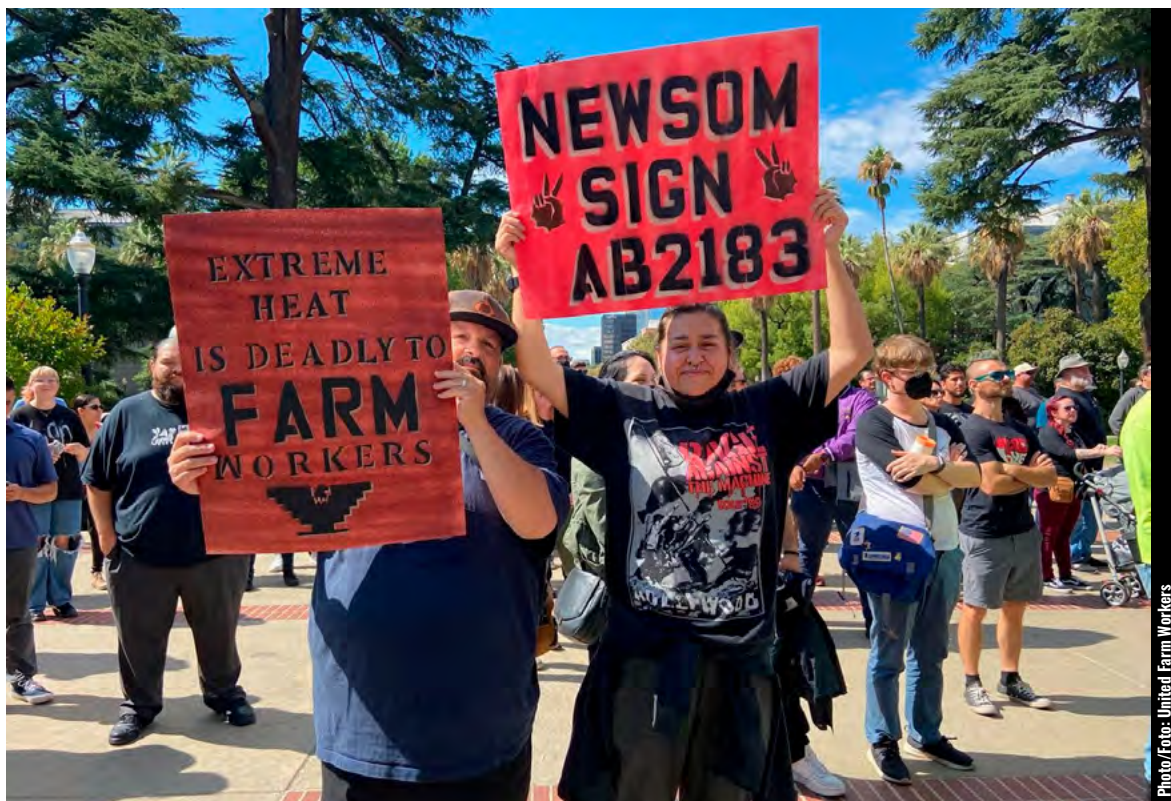
A monthlong push by United Farm Workers of America and the California Labor Federation ended in victory for farmworkers, as California Gov. Gavin Newsom signed AB2183 on September 28, 2022. / La presión ejercida durante un mes por la Unión de Campesinos de América y la Federación de Trabajadores de California terminó con una victoria para los trabajadores agrícolas, ya que el gobernador de California, Gavin Newsom, firmó la ley AB2183 el 28 de septiembre de 2022.

The Democratic governor's about-face on the measure represents a major victory for labor leaders. It follows a monthlong push by United Farm Workers of America (UFW) and the California Labor Federation (CLF) and comes in the wake of pressure from President Joe Biden and two high-ranking national Democrats with California ties—Vice President Kamala Harris and House Speaker Nancy Pelosi.